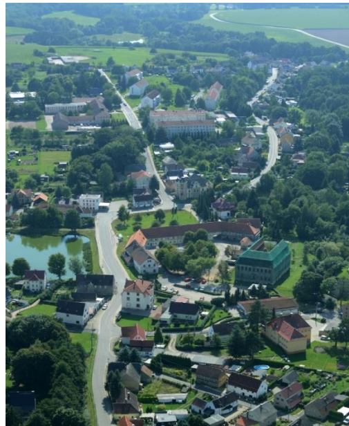
Blick über Lgl.-Niederhain