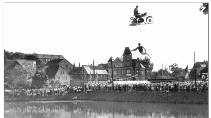
Geschwister Weisheit Auftritt zum Rosenfest